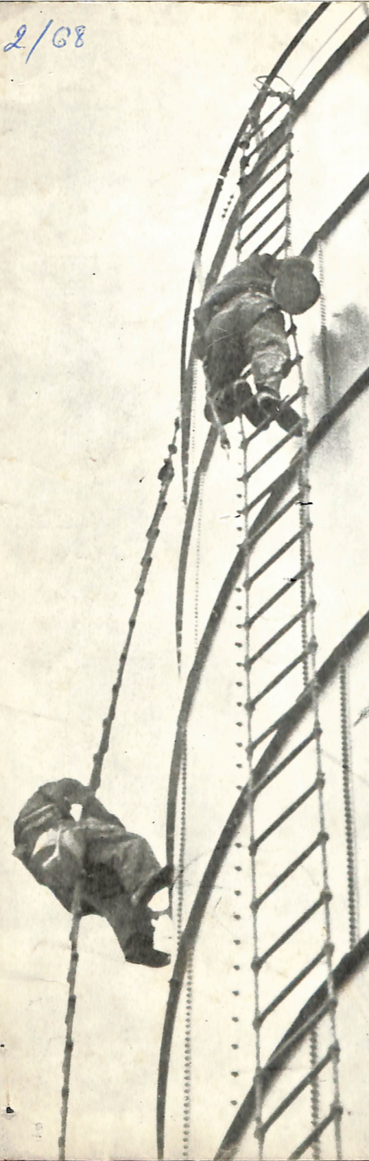
ФОТО КИНО СОЈУЗ НА МАКЕДОНИЈА — ФОТО КЛУБ „В А Р Д А Р“ — СКОПЈЕ